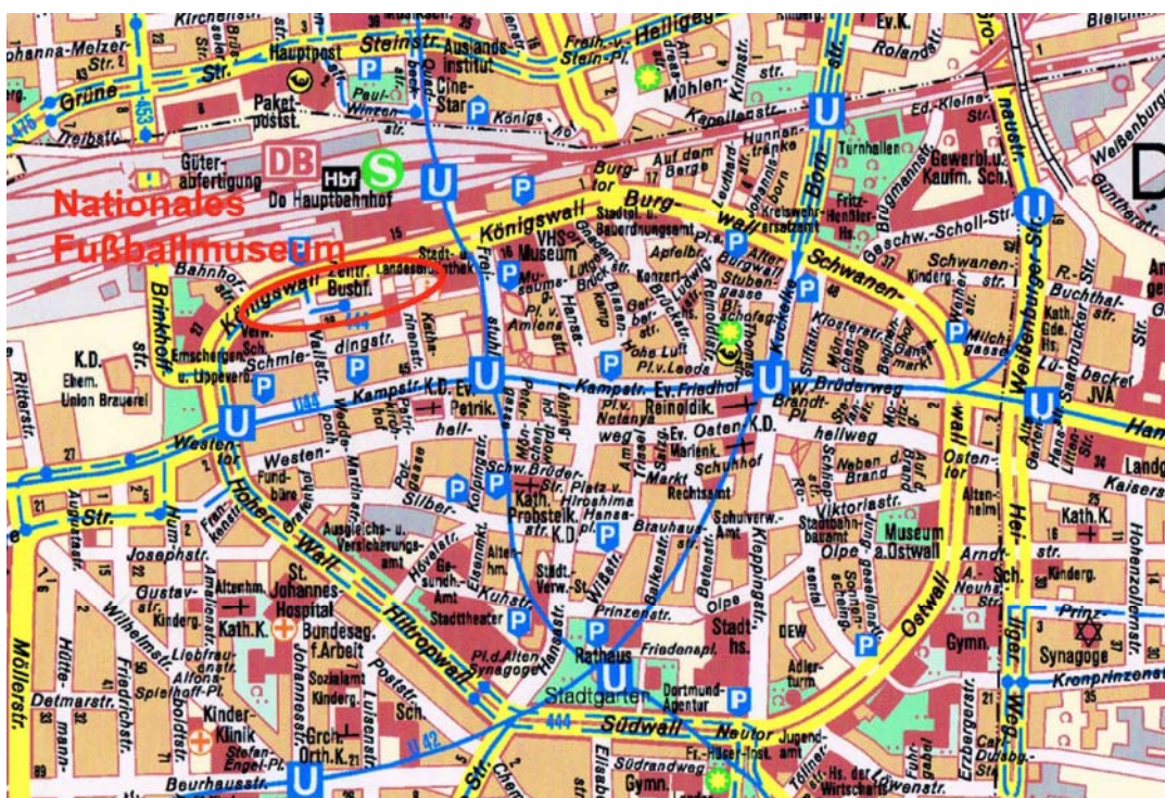
Stadtplan Innenstadt Dortmund

Das Grundstück hat eine Größe von rund 6.000 m 2 .